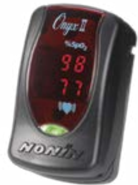
Onyx II 9550

Energie-efficiënt – Voorziet in meetwaarden voor tot 10.000 losse controles of 63 uur continue bewaking en gebruikt ter verlenging van de levensduur van de batterij geen stroom wanneer die buiten gebruik is.