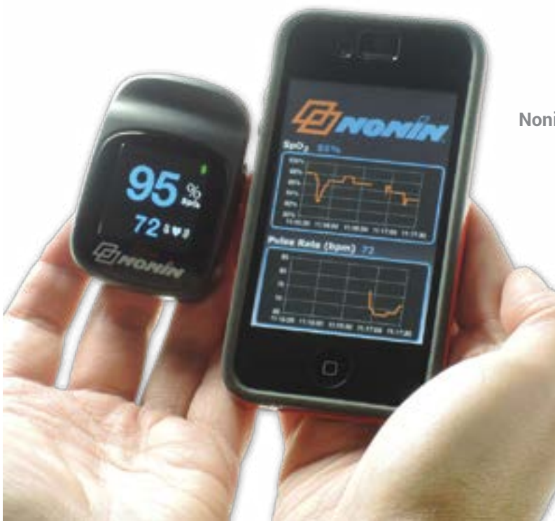
NoninConnect Elite 3245

Blijvende waarde – Er kunnen op twee AAA-batterijen 2.200 losse controles mee worden gedaan; de meter heeft een garantie van 2 jaar.