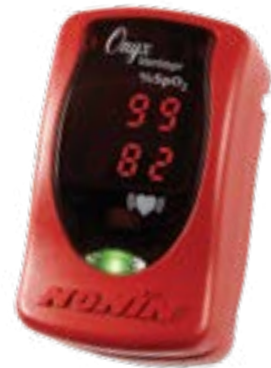
Onyx Vantage 9590

Blijvende waarde – Voorziet in meetwaarden voor tot 6.000 losse controles of 36 uur continue bewaking op twee AAA-batterijen.