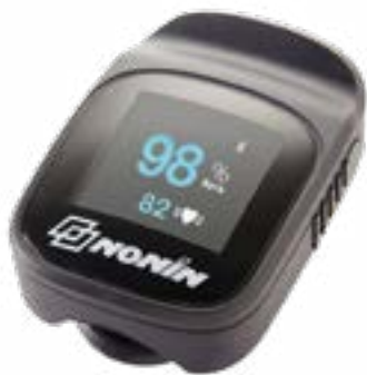
Model 3230 Bluetooth LE

Bij de draadloze Model 3230 Bluetooth LE-vingerpulsoxymeter is gebruikgemaakt van Bluetooth® Low Energy-technologie waarmee artsen op combineerbare Apple®-apparaten vanaf een afstand binnen 10 m tot de patiënt realtime meetwaarden van de SpO 2 kunnen bekijken.