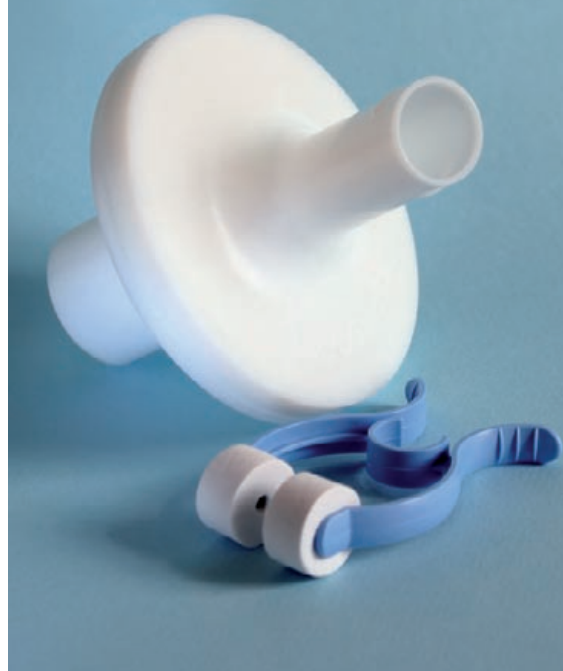
Filter kit MG IIC (MicroGard IIC + disposable rubber mondstuk + neusklem)